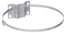
ARTIKULS: 13200 STIPRINĀJUMS IZPLEŠANĀS TRAUKAM UNIVERSĀLAIS LĪDZ 25 LITRIEM, 325MM